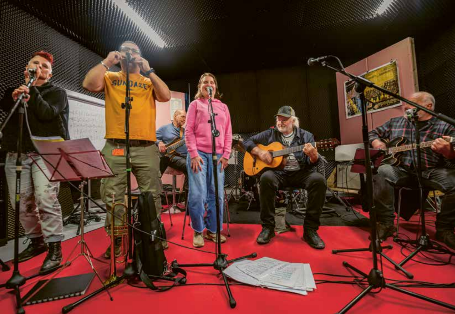
Jetzt geht die Post ab: «Go Wanderer» spielen mit Peach ihre Dialektfassung des Status-Quo-Hits «Rockin' all over the world».

jetzt, während er die «Leihgitarre» kritisch begutachtet und seine Finger in Stellung bringt. «Die haben ein Leben lang eigentlich nur einen einzigen Song geschrieben, sind aber mit jeder Variation davon wieder in der Hitparade gelandet.»